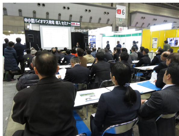
セミナー講演の様子